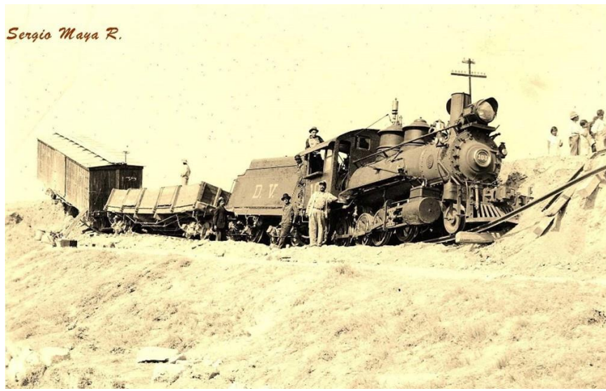
“La Cucaracha” descarrilada en el km 7 del tramo correspondiente al Gran Canal (mayo 3, 1934).

México que era llevado hasta la capital del país. Durante la revolución este tren cargó armamento y provisiones para apoyar tanto a los federales como a las tropas zapatistas. Poco después se le agregó un vagón de pasajeros pequeño.